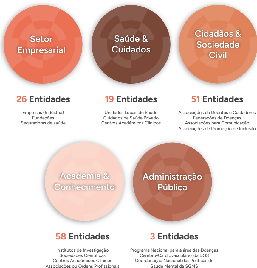
Figura 1 – Distribuição das entidades participantes e/ou subscritoras do documento de posição conjunta (dados atualizados em junho de 2026).

A partir de uma análise SWOT (Anexo I) desenvolvida em colaboração com representantes de várias entidades que desempenham diferentes tipos de atividades dirigidas à promoção da saúde do cérebro, pretende-se sensibilizar os decisores políticos e a sociedade em geral para a necessidade urgente de priorizar a investigação e inovação em saúde do cérebro nas políticas públicas, de investigação e inovação, e de prática clínica e assistencial. O objetivo é conseguir o endosso interministerial (Ministérios da Saúde; da Educação, Ciência e Inovação; do Trabalho, Solidariedade e Segurança Social; da Economia e das Finanças); para o incremento do apoio estratégico e financeiro; e para o robustecimento das capacidades científicas e clínicas nacionais. Através da articulação dos diferentes setores envolvidos, o documento propõe recomendações e ações concretas para acelerar o progresso e enfrentar os desafios desta área, disseminando a mensagem categórica de que “não há saúde sem saúde do cérebro”.