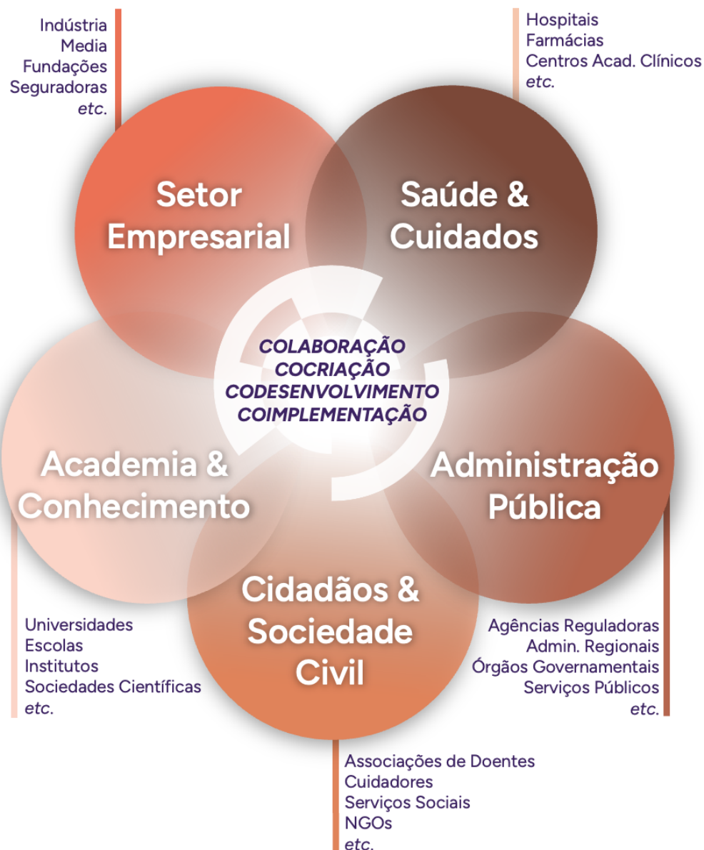
Figura 2 – Representação esquemática do modelo Penta-hélice de colaboração intersectorial de stakeholders. Cada grupo de intervenientes agrupado em macro, meso e subgrupos (setor > subsetor > interveniente individual).